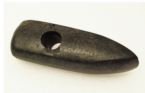
Kamenný broušený sekeromlat.

Téměř nemáme doklady, že by se v našem pravěku kámen uplatnil jako stavební materiál, za to byl využíván při úpravě hrobů, např. jako obložení, desky ve skříňkových hrobech nebo do kamenných pláštů mohyl.