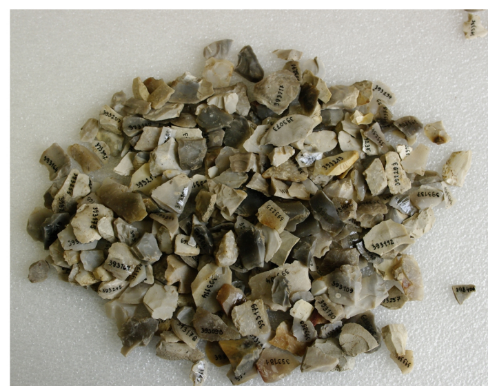
Kamenná štípaná industrie