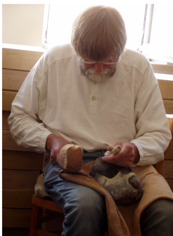
Experimentální opracování kamene